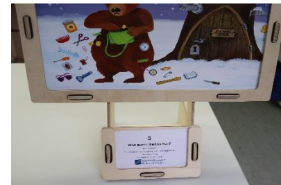
Bild-Rahmen wahlweise quer oder hochkant mittig über Text-Platte an Seitenteile anlehnen.

Eine Bitte: Für den Transport ist es am einfachsten, wenn der Bild-Rahmen zusammengebaut bleibt und nur die Bild-Basis so in Einzelteile zerlegt wird, dass diese in der Klarsicht-Tasche sicher verstaut werden können.